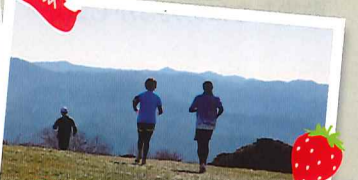
広大なまきばの向こうには九十九谷の展望が広がります。