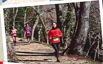
緑あふれる森林コース