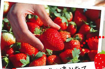
給水所では摘みたてイチゴでビタミンチャージ!