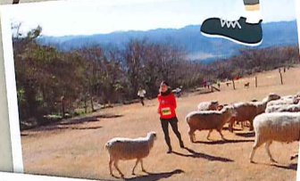
そして、ヒツジの群の中を走り抜けます!